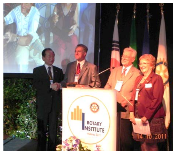
Remise du prix au Rotary Institute de Milan